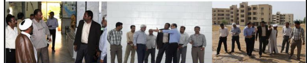
کلی از دیدار صومعی اداره کل شیلات هرمزگان